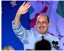
Dal look alle parole: è il Pd «inclusivo» voluto da Zingaretti